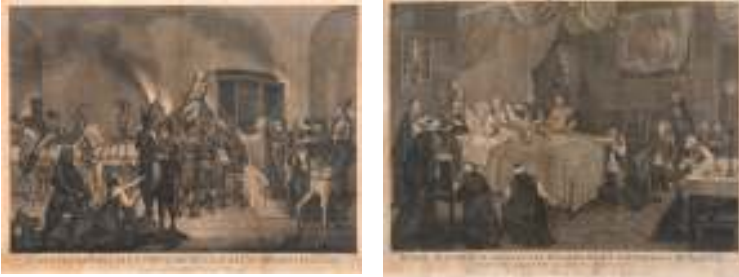
73 (due di cinque)