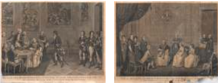
74 (due di cinque)