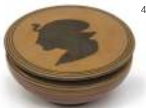
4 PISSIDE, XX SECOLO in terracotta con decorazione a testa di profilo. Integra. Misure cm. 7 x 15. M.O.