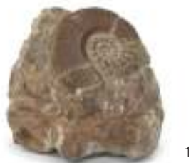
1 FOSSILE DI CELENERATO, EPOCA NON DEFINIBILE Misure cm. 5 x 5,5 x 6. M.O.