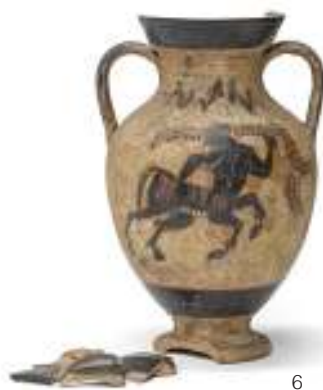
6 ANFORA A FIGURE NERE, XX SECOLO in ceramica, con decorazione con centauro a sinistra. Mancanze sul collo e sul piede con frammenti inclusi. Misure cm. 25 x 14 x 17. M.O.