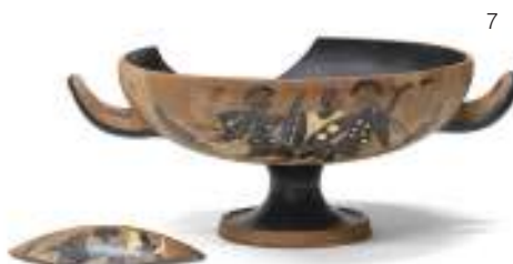
7 KYLIX A FIGURE NERE, XX SECOLO di gusto archeologico, in ceramica decorata nella vasca con figura ammantata e sul corpo con scene di combattimento. Misure cm. 12 x 23. Rottura al bordo, difetti. M.O.