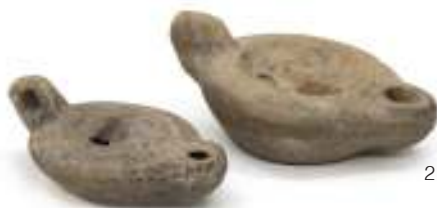
2 DUE LUCERNE, XIX SECOLO in terracotta con decorazione a rilievo. Integre. Misure maggiore cm. 5 x 9 x 13. M.O.