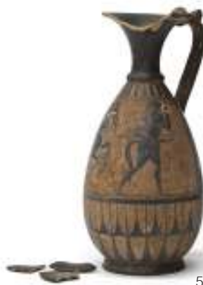
5 LEKYTHOS A FIGURE NERE, XX SECOLO di stile archeologico, in ceramica con decorazione a figure nere con cavaliere e satiro a destra. Rotture e frammenti inclusi. Misure cm. 29 x 13 x 13. M.O.