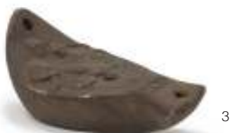
3 LUCERNA IN TERRACOTTA, XIX SECOLO con decorazioni a rilievo. Integra. Misure cm. 7 x 8 x 14. M.O.